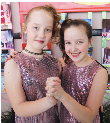
XII открытый районный конкурс исполнителей эстрадной песни «Российские колокольчики» вновь звенел на чернорицкой сцене.

В Чернорицком сельском доме культуры вновь было шумно и весело. В двенадцатый раз в нем прошел открытый районный песенный конкурс юных исполнителей эстрадной песни «Российские колокольчики».